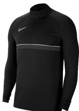
BLUZA DRESOWA CZARNA