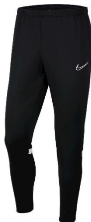
SPODNIE DRESOWE CZARNE