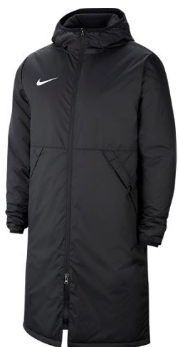
KURTKA ZIMOWA Dziecięca CW6158 CENA: 295 PLN Męska CW6156 CENA: 320 PLN