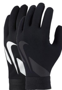
RĘKAWICZKI Dziecięce CU1595 CENA: 60 PLN Męskie CU1589 CENA: 70 PLN