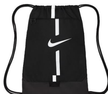
WOREK TRENINGOWY DA5435 CENA: 45 PLN