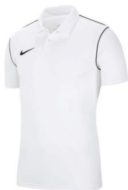
POLO BIAŁE Dziecięce BV6903 CENA Z LOGO: 70 PLN Męskie BV6879 CENA Z LOGO: 75 PLN