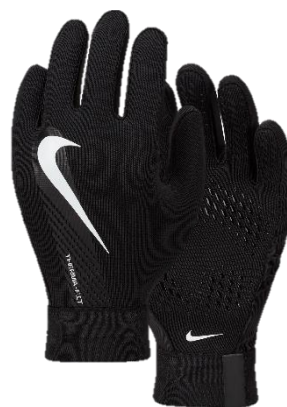
RĘKAWICZKI Dziecięce DQ6066 CENA: 60 PLN Męskie DQ6071 CENA: 70 PLN