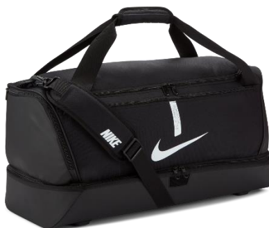
TORBA MEDIUM 53x30x27/37l CU8096 CENA Z NADRUKIEM: 130 PLN TORBA LARGE 64x31x30/59l CU8087 CENA Z NADRUKIEM: 145 PLN