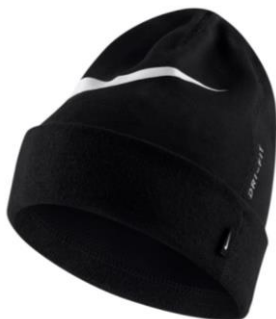
CZAPKA AV9751 CENA: 60 PLN