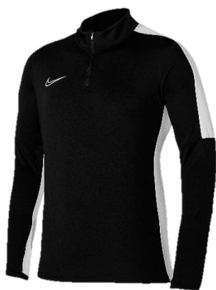
BLUZA DRESOWA CZARNA

Dziecięca DR1356 CENA Z LOGO: 135 PLN Męska DR1352 CENA Z LOGO: 145 PLN