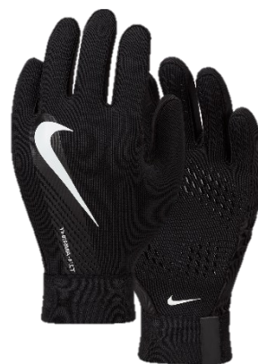
RĘKAWICZKI Dziecięce DQ6066 CENA: 80 PLN Męskie DQ6071 CENA: 90 PLN