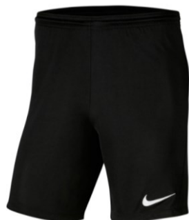
SPODENKI TRENINGOWE CZARNE

Dziecięca BV6741 CENA Z LOGO: 65 PLN Męska BV6708 CENA Z LOGO: 75 PLN