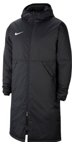
KURTKA ZIMOWA Dziecięca CW6158 CENA: 350 PLN Męska CW6156 CENA: 380 PLN