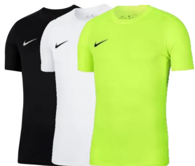
KOSZULKA MECZOWA BIAŁA LUB CZARNA