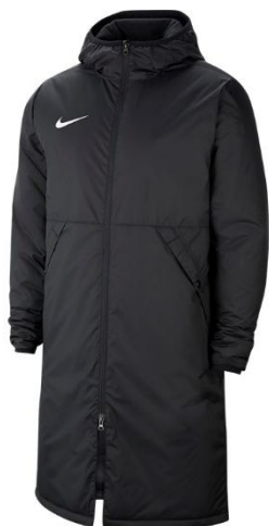
KURTKA ZIMOWA Dziecięca CW6158 CENA: 350 PLN Męska CW6156 CENA: 380 PLN