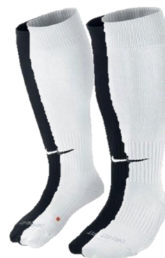
GETRY MECZOWE BIAŁE LUB CZARNE