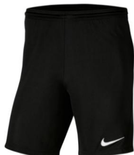
SPODENKI TRENINGOWE CZARNE

Dziecięca BV6741 CENA Z LOGO: 65 PLN Męska BV6708 CENA Z LOGO: 75 PLN