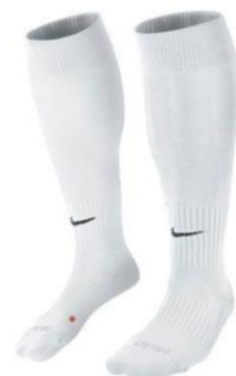
GETRY TRENINGOWE BIAŁE

Dziecięce BV6865 CENA: 55 PLN Męskie BV6855 CENA: 60 PLN