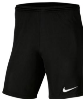
SPODENKI MECZOWE CZARNE