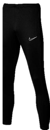
SPODNIE DRESOWE CZARNE

Dziecięca FZ9773 CENA Z LOGO: 135 PLN Męska FZ9767 CENA Z LOGO: 145 PLN