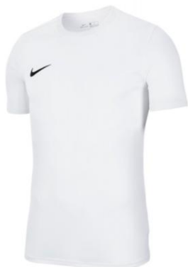
KOSZULKA TRENINGOWA BIAŁA

Dziecięca BV6741 CENA Z LOGO: 65 PLN Męska BV6708 CENA Z LOGO: 75 PLN