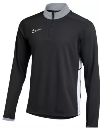
BLUZA DRESOWA CZARNA

Dziecięca FZ9773 CENA Z LOGO: 135 PLN Męska FZ9767 CENA Z LOGO: 145 PLN