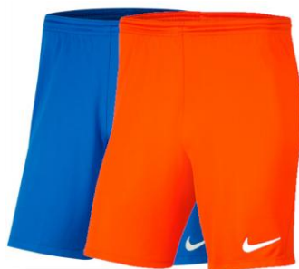
SPODENKI BRAMKARSKIE NIEBIESKIE/POMARAŃCZOWE