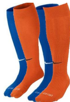
GETRY BRAMKARSKIE NIEBIESKIE/POMARAŃCZOWE