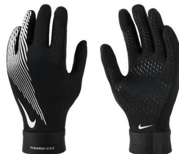
RĘKAWICZKI Dziecięce HF0547 CENA: 80 PLN Męskie HF0546 CENA: 90 PLN