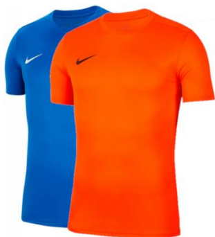
KOSZULKA BRAMKARSKA NIEBIESKA/POMARAŃCZOWA